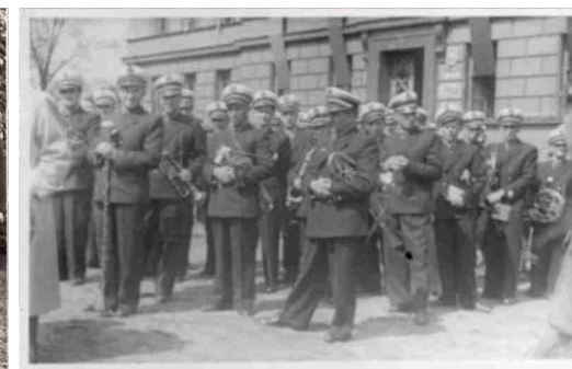
Pierwszy skład orkiestry