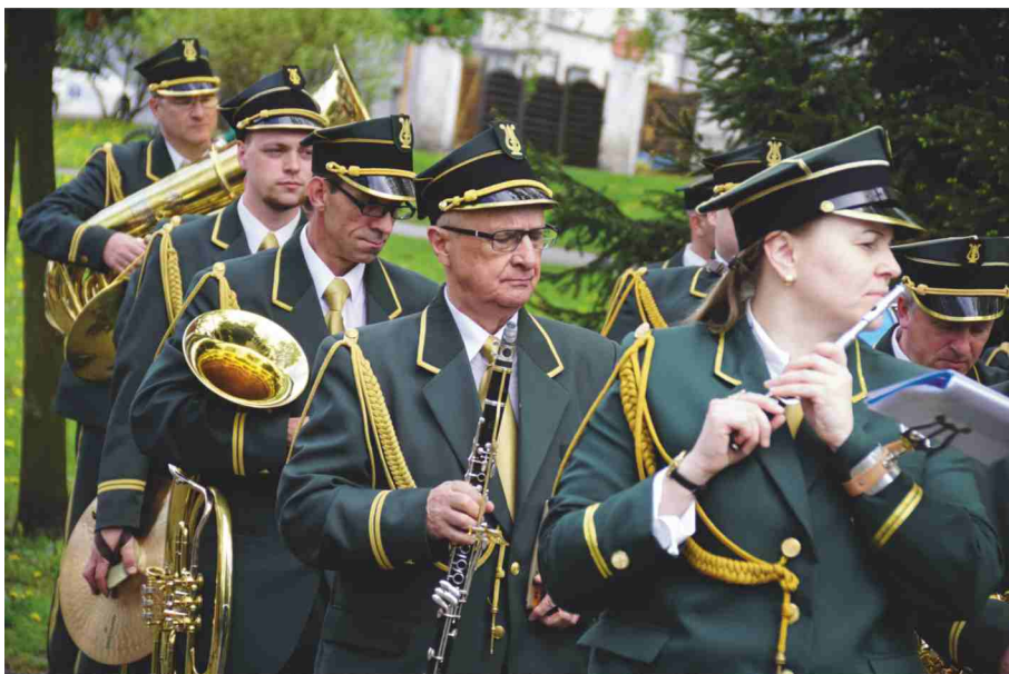
Orkiestra kilku pokoleń Zielonogórczan