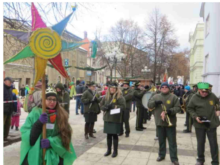
Przemarsz podczas Orszaku Trzech Króli w 2017 r.